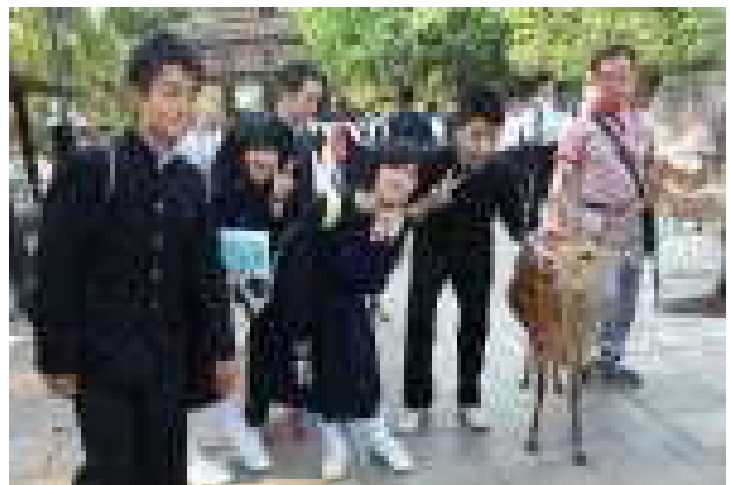
<南大門前で鹿と一緒にポーズ>

出発当日、天気予報では雨でしたが、一度も降られることなく、善光寺駐車場→静岡→京都→奈良という経路で初日の移動や見学が始まりました。見るもの全てが雄大で、